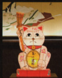
宮若市特産の「追い出し猫」

※上記の時間は、高速道路を利用した場合のおよその時間です。 道路状況や天候等の都合により変わる場合がございます。